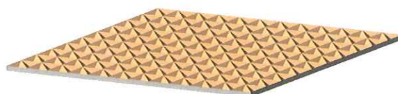
図 3 3枚鏡タイプの再帰反射パネル